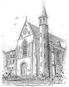
Parochie O.L.V. Onbevleekt Ontvangen Zenderen

Op vrijdag 17 mei is er een informatieavond over de toekomst van onze parochie.